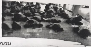
ทดสอบก่อน-หลังอบรม